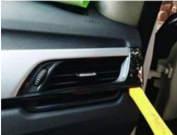
4. Hebeln Sie die Original-Luftauslassblende heraus