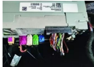
11. Ziehen Sie den Stecker des Originalmotors ab.