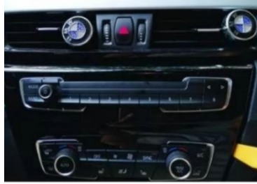
2. Hebeln Sie die zentrale Steuerkonsole des Originalfahrzeugs heraus