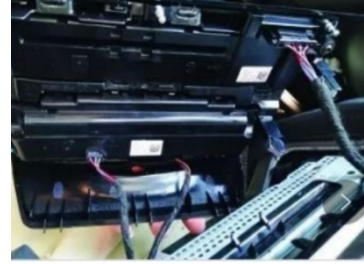
3. Ziehen Sie den Stecker des Bedienfelds ab.