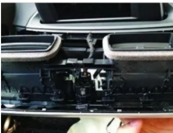
7. Den Stecker der Luftauslassblende des Originalfahrzeugs abziehen