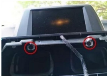
8. Entfernen Sie die Befestigungsschrauben des Original-Autobildschirms