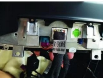
13. Schließen Sie unseren Bildschirm an