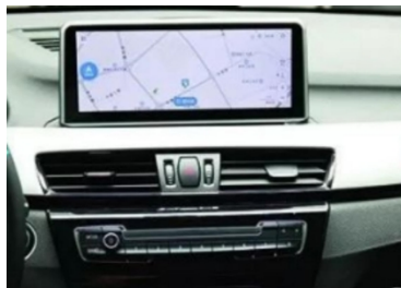
14. Effektbild nachher Installation