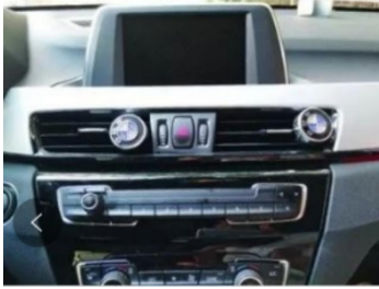
1. Zentralsteuerungsdiagramm des Originalfahrzeugs