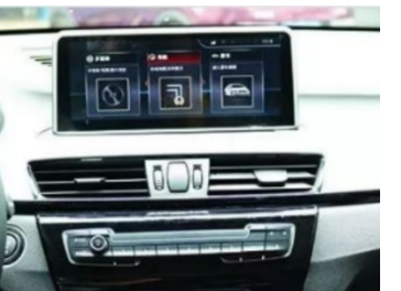
15. Effektbild nach der Installation