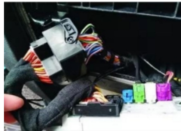
12. Verbindung zwischen Stecker und Original-Motorstecker