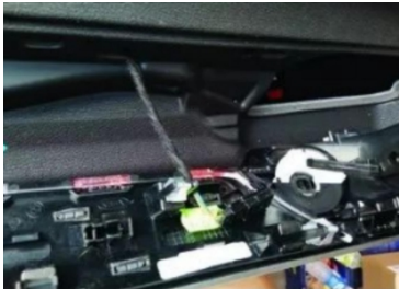
6. Ziehen Sie den Stecker der Luftauslassblende des Originalfahrzeugs ab.