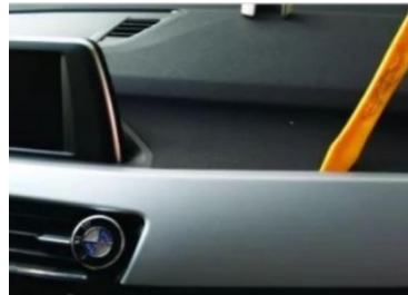
5. Hebeln Sie die Original-Luftauslassblende heraus